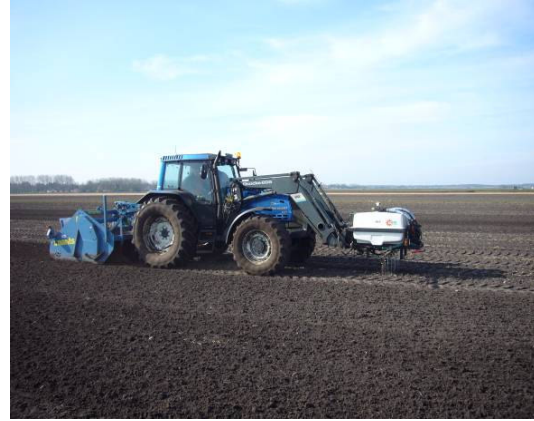
Figuur 3: Spitcombinatie