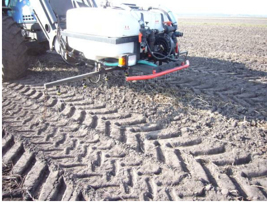
Figuur 2: NTS toediening